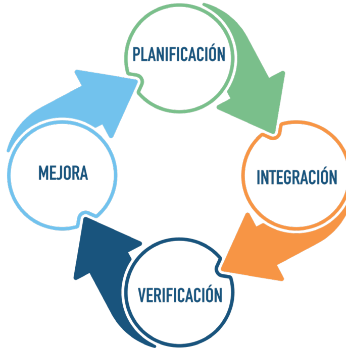
Figura 1. Ciclo de mejora continua de CPS. CEGESTI.